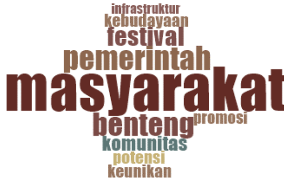
Gambar 3. Content Analysis-Word Frequencies

Dari hasil running data dengan menggunakan menu word frequencies , diperoleh 10 kata yang paling sering diucapkan oleh narasumber terkait dengan fenomena pengembangan pariwisata berbasis budaya di Wakatobi yakni sebagai berikut :